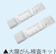
▲大腸がん検査キット

大腸がん検診(検査キットの受け渡しと回収)は、上記のけんしん会場と健康センターはぴふるで実施しています。