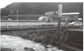
▲点検車による点検状況

道路にかかる橋は、約3割が建設後50年以上経過するなど、老朽化が進んでおり、一部の橋では鋼材の腐食やコンクリートの剥がれ落ちなど、損傷が生じています。