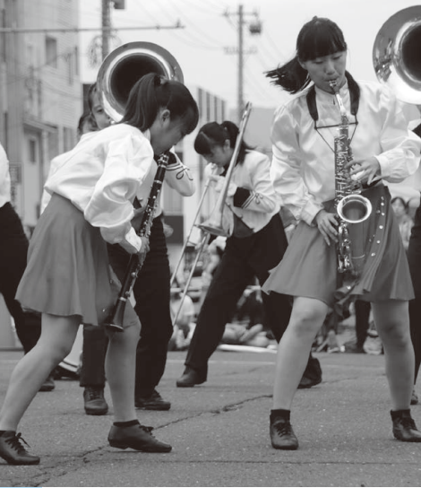
▲敦賀まつり カーニバル大行進