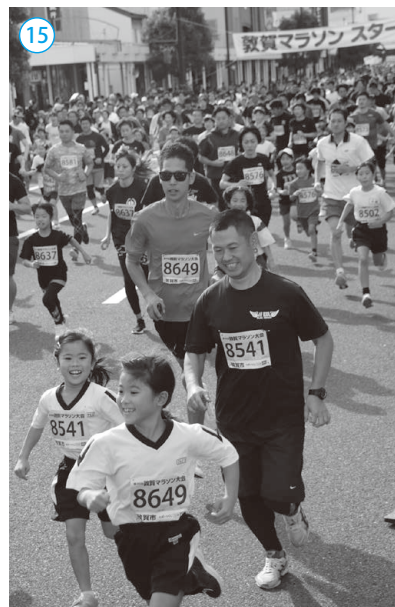
▲2,549人が参加した敦賀マラソン