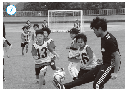
▲フェスタでは一流アスリートが子どもたちを指導