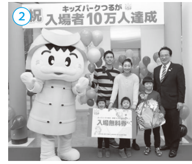
▲キッズパークつるがが10万人目の入場者