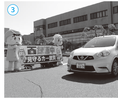
▲見守るカー敦賀出発式