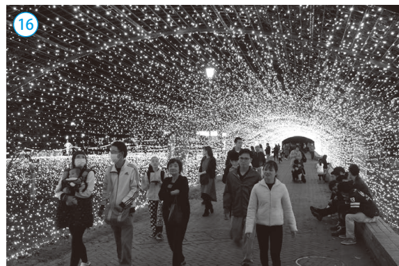
▲敦賀港イルミネーション「ミライエ」

敦賀西町の綱引き。キッズパークつるがの入場者が10万人を突破。ドライブレコーダー見守り活動事業「見守るカー敦賀」始まる。第2産業団地への初誘致企業が決定。病児・病後児保育施設「はぴけあ」落成式。敦賀港と博多港を結ぶRORO船の新航路開設。来迎寺橋の橋桁撤去完了。敦賀市長選挙で洲上隆信市長が2度目の当選。新元号「令和」が始まる。産業構造の複軸化などを目的とした「ハーモニアスポリス構想」策定。ボールゲームフェスタin敦賀。敦賀市駅前立体駐車場供用開始。敦賀港カッターレース。