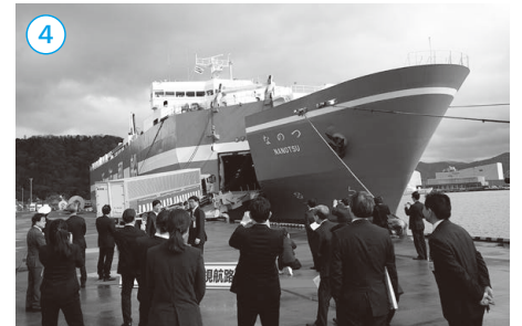
▲敦賀博多間に新たに就航したRORO船「なのつ」