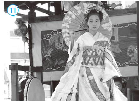
▲敦賀まつり 宵山巡行