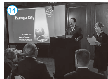
▲在ニューヨーク総領事公邸にて市長によるプレゼンテーション