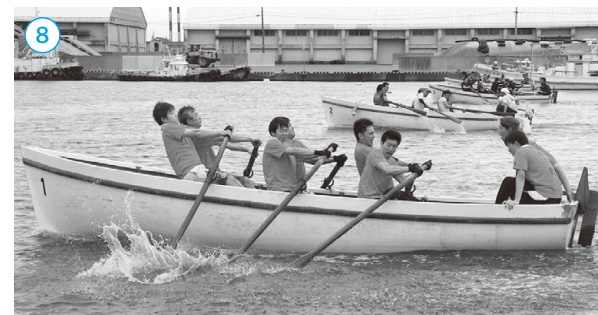
▲敦賀港カッターレース