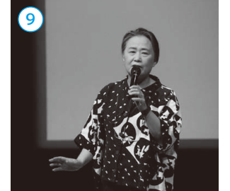
▲夏井いつき句会ライブ