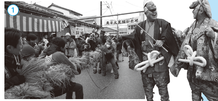
▲敦賀西町の綱引き