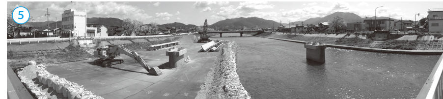
▲来迎寺橋の橋桁全撤去完了後の筥の川（中央に2つある橋脚は来迎寺橋のもの）