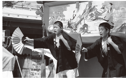
▲敦賀まつり 山車巡行