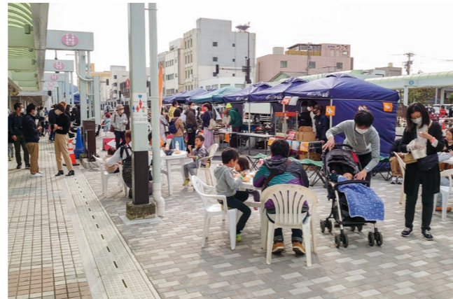
▼空間活用イベントの様子