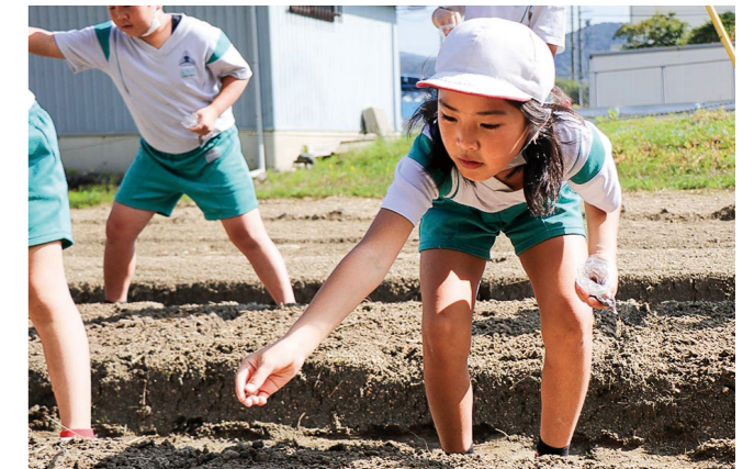
▼黒河マナの種をまく児童

市立博物館が実施する山車総合調査の一環で、市の有形文化財である唐仁橋山車の解体調査が行われました。この調査は、構造や使われている部材、歴史背景などを把握し、今後の山車の活用や維持に活かすことを目的に行われるもので、昭和56年に山車の格納庫ができて以来、およそ40年ぶりの解体となりました。組み立て作業を行った10月17日、福井ヘリテージ協議会とつがるの山車保存会のメンバーがあらかじめマーキングした目印を確認しながら、慎重に元の姿に組み立てていきました。