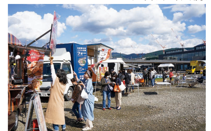
▼ケータリングエリアの様子

10月31日、「With コロナ時代の新幹線開業を見据えた多様な受け皿づくり」をテーマとしたまちづくりシンポジウムが開催されました。基調講演やパネルディスカッションでは、ライフスタイルの変化や、都市と地方の関係性の変化を切り口に、全国で起こっているムーブメントの紹介や、まちづくりの新しい発想や可能性についての提言がなされました。今後も、市民の皆さまとともに、機運醸成につながる取組みを進めてまいります。