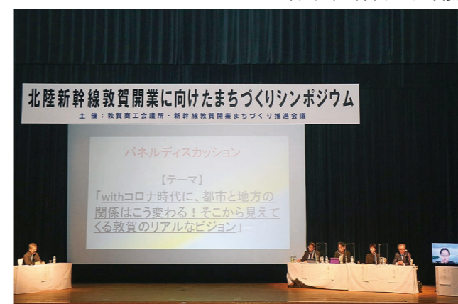
▼パネルディスカッションの様子