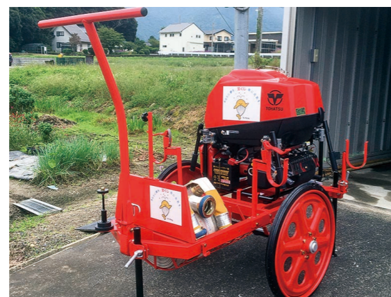
▲整備した消防ポンプ

(一財)自治総合センターからの宝くじ助成(地域防災組織育成助成事業)を受けて、長谷区が消防ポンプを整備しました。今後も安全・安心な地域づくりに取り組んでまいります。