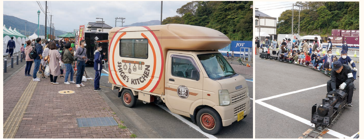
▲フードトラックストリート ▲鉄道フェスティバル