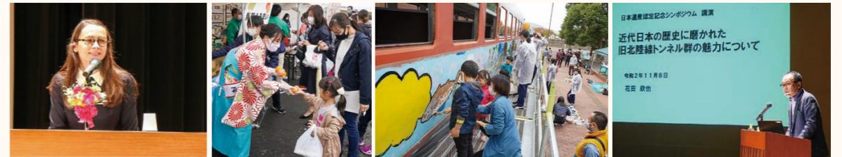
▲人道の港シンポジウム ▲無料ふるまい ▲キハ28形気動車に色を塗る親子 ▲日本遺産認定記念シンポジウム