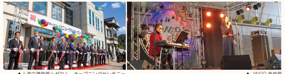
▲人道の港敦賀ムゼウム オープニングセレモニー ▲JINDO 音楽祭