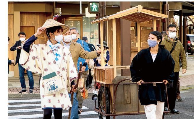
▼トークイベントの後、微遍路として松原に向かう一行

2024年春の北陸新幹線敦賀開業に向けて、官民が連携して整備を進める敦賀駅西地区で、ホテル棟新築工事の起工式が行われました。式典では、地鎮行事などを行い、工事の安全を祈りました。駅西地区には、この日起工したホテルを中心として、地元の食をPRする飲食・物販施設や、子育て支援施設、知育・啓発施設など、さまざまな機能が整備される予定です。活気に満ちた魅力あふれる、港まち敦賀の「玄関口」となって、敦賀の交流とにぎわい拠点づくりに大きく貢献するものと期待されます。