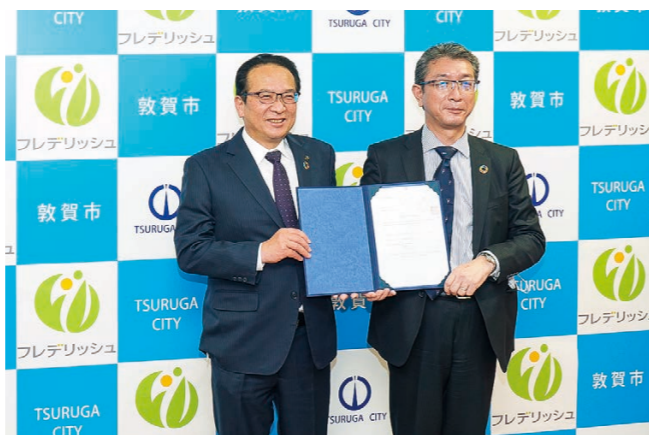
▼補助金交付指定通知書を手に記念撮影

皆さんの「プラス1」を紹介しませんか？詳しくは、健康推進課（☎25-5311）までお気軽にお問合せください。