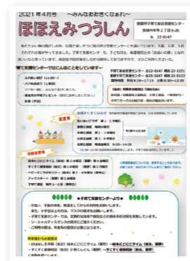
▲センターで配布する「ほほえみつうしん」

乳幼児期やその後の子育てに役立つ知識が学べる講座・教室を開催しています。実施日や内容は広報つるがやHPにてお知らせしています。