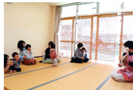
▲絵本の読み聞かせの様子。センターでは定期的に消毒・換気を行い、人数制限などの新型コロナウイルス対策を行っています。

0歳〜3歳位のお子さんに合った遊具やおもちゃがたくさんあり、明るく清潔で安全なひろばで遊べます。親子で楽しむふれあい遊びなども実施しています。ひろばには、すべり台など子どもたちが自由に楽しめる遊具を設置しています。