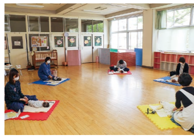
▲講座に参加する家族同士が知り合いになるなど、子育て家族の交流を深めるきっかけにもなっています。

新和町1丁目3-10 ☎25-5647 開所時間 平日 8:30~17:15 土曜 8:30~12:30 休館日 日曜・祝日・年末年始