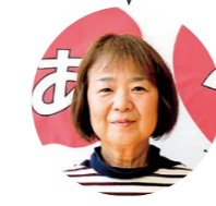
子育てコーディネーター