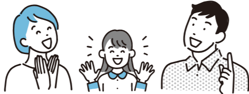
児童クラブ一覧 (令和4年4月～)