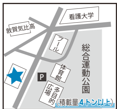
総合運動公園西側駐車場