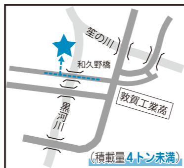
黒河川左岸(和久野橋下流)