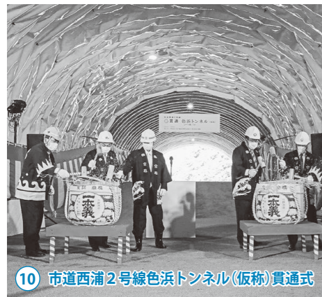
10 市道西浦2号線色浜トンネル(仮称)貫通式