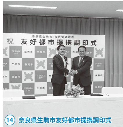
14 奈良県生駒市友好都市提携調印式