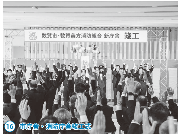
16 市庁舎・消防庁舎竣工式