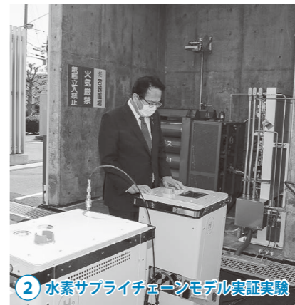
2 水素サプライチェーンモデル実証実験