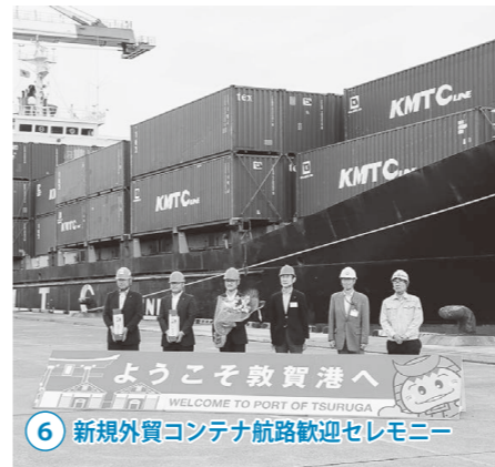
6 新規外貿コンテナ航路歓迎セレモニー