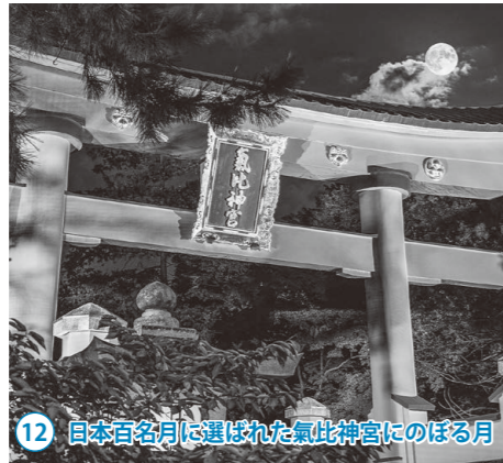
12 日本百名月に選ばれた氣比神社にのぼる月