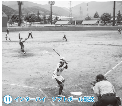
11 インターハイ ソフトボール競技