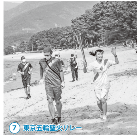
7 東京五輪聖火リレー