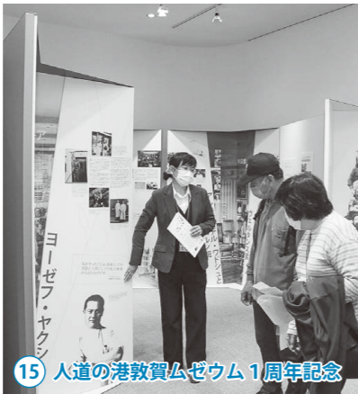
15 人道の港敦賀ムゼウム1周年記念