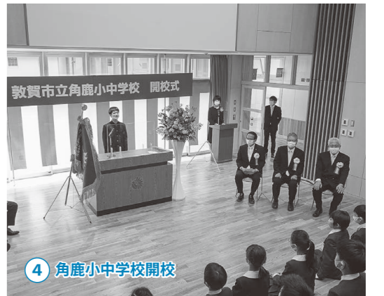
4 角鹿小中学校開校