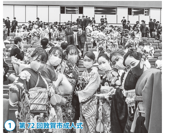
1 第72回敦賀市成人式