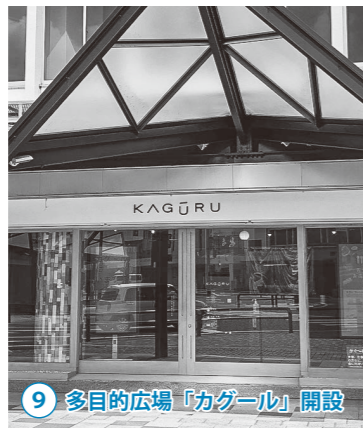
9 多目的広場「カグル」開設