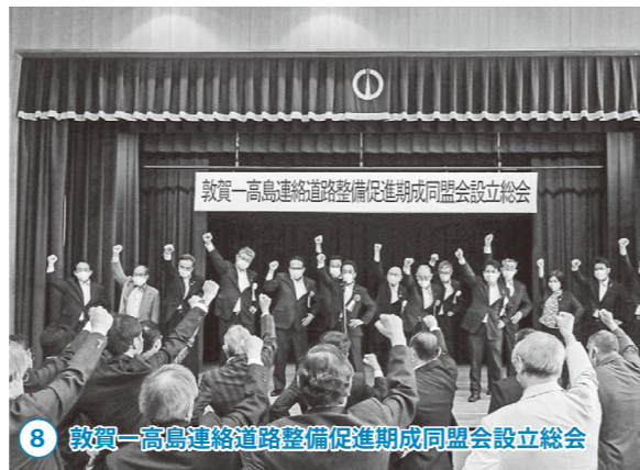
8 敦賀-高島連絡道路整備促進期成同盟会設立総会