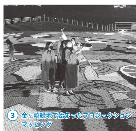
3 金ヶ崎緑地で始まったプロジェクションマッピング