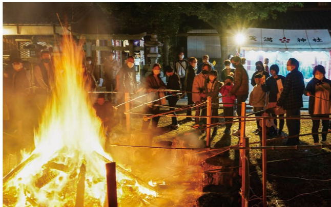
▼かがり火を囲みせんべいを焼く参拝者