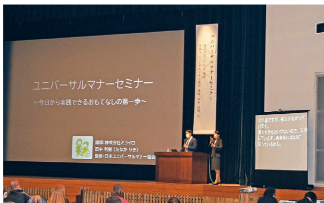
▼ユニバーサルマナーについて講演する講師

皆さんの「プラス1」を紹介しませんか?詳しくは、健康推進課(☎25-5311)までお気軽にお問合せください。