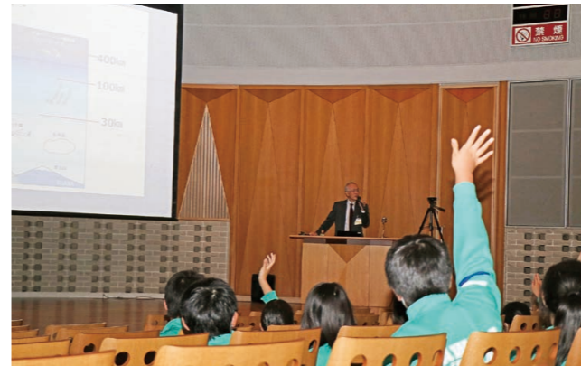
▼若狭湾エネルギー研究センターでの特別授業の風景

栄新町の天満神社境内で伝統行事「せんべい焼き」が行われました。この行事は、同神社境内にある恵比須神社で380年以上続くと伝えられ、かがり火で焼いたせんべいを食べれば悪病を払い、無病息災・家内安全のご利益があるといわれています。訪れた参拝者は、3mほどの青竹の先に生せんべいを挟み、焦げないように気をつけながらじっくり焼いていました。境内は香ばしい香りに包まれ、熱々のせんべいを美味しく丁寧に頬張る参拝者でにぎわいました。