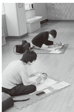
▲講座に参加する親子

新和町1丁目3-10 ☎25-5647 ＜開所時間＞ 平日8:30~17:15 土曜8:30~12:30 ＜休館日＞ 日曜・祝日・年末年始