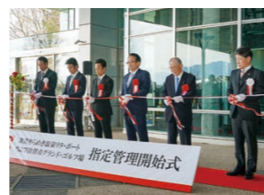
▲指定管理開始セレモニー

新たな指定管理者のもと、4月9日から運営を再開しました。癒しの時間を求めて、新しくなったリラ・ポートへ、ぜひお越しください。