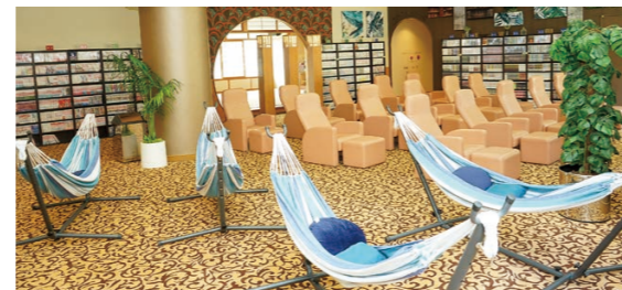
▲休憩コーナーにはハンモックを設置

漫画コーナー、エクササイズコーナー、キッズルームを整備しており、幅広い層のお客さまが楽しめます。