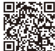
ダウンロードはこちら