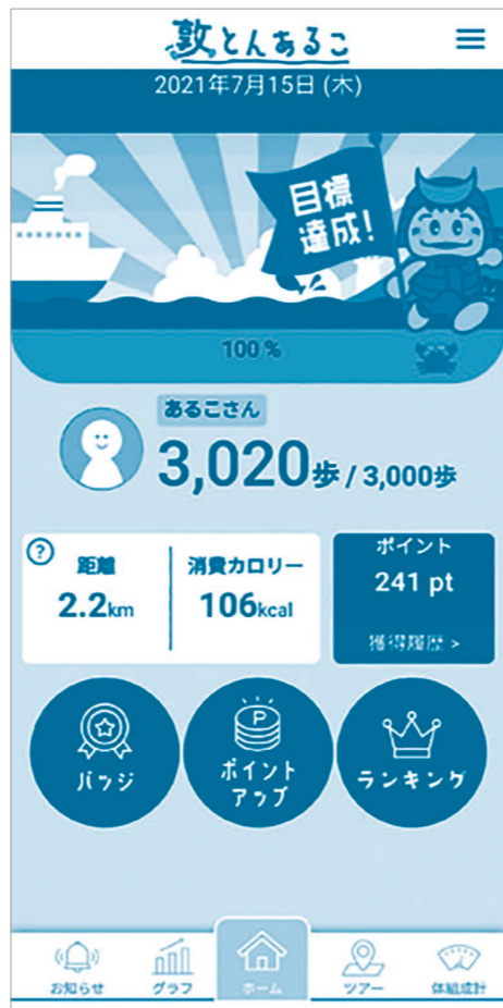
▲アプリ画面イメージ