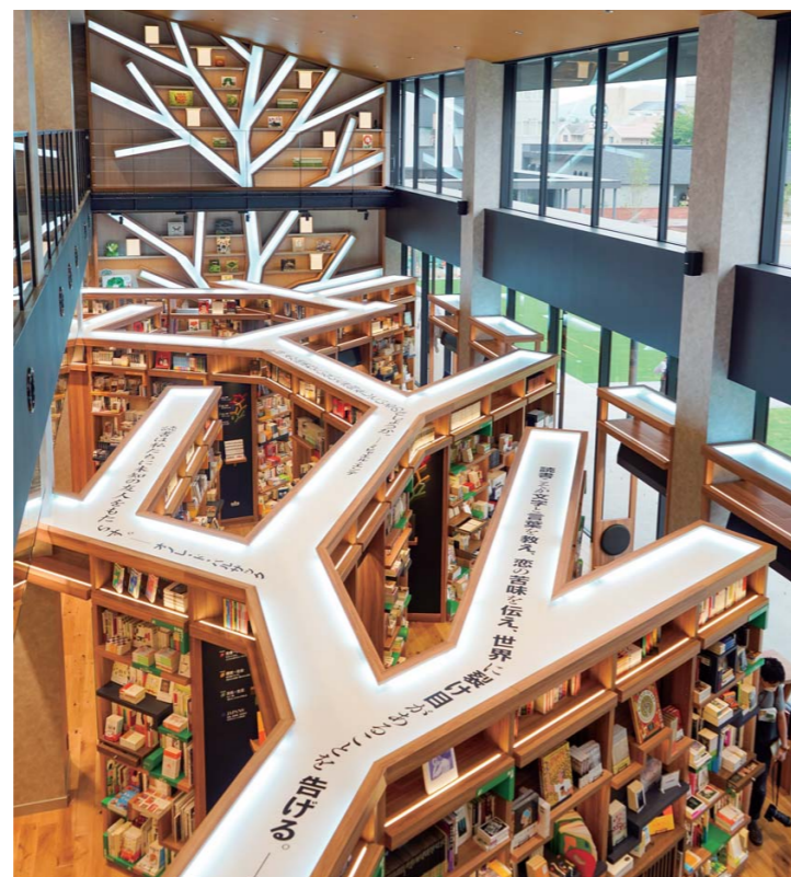
▲1～2Fの吹き抜け部分（空間コンセプト：World Tree～世界樹～）