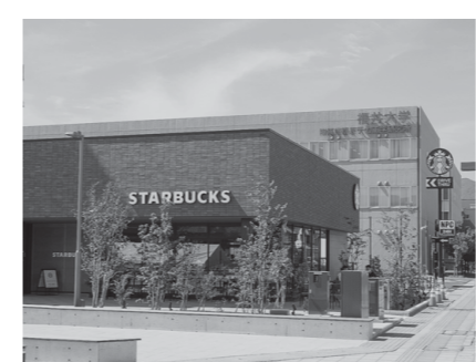
▲スターバックスコーヒーが嶺南初進出