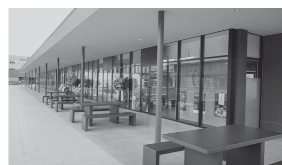
▲飲食棟の屋外テーブル席