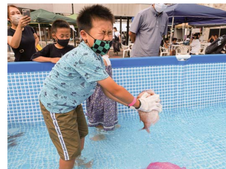
▲つるがこども縁日 敦賀おさかなパラダイス