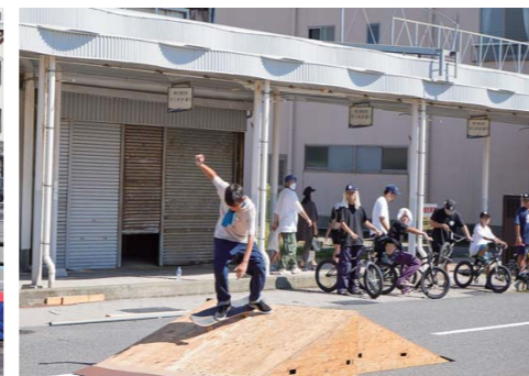
▲相生祭 スケートパフォーマンス