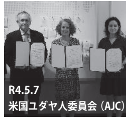
R4.5.7 米国ユダヤ人委員会 (AJC)