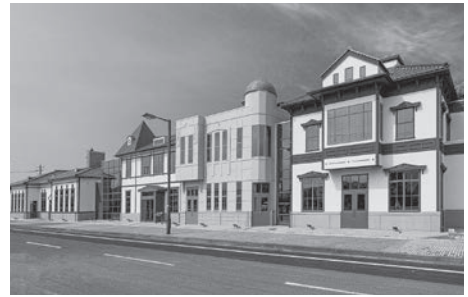
▲ムゼウムでは「人道の港」のエピソードを通じて、「命の大切さ、平和の尊さ」を発信しています。

この2年間、市民の方々をはじめ、各国の大使や海外からのお客さままで幅広くご来館いただき、「『人道の港』をもっと世界に発信し、次の世代に語り継ぐべき歴史である」との言葉もいただいております。 まだ、一度もムゼウムにお越しいただいたことのない方、既にお越しいただいた事のある方も、2周年を迎えるムゼウムにぜひご来館ください。