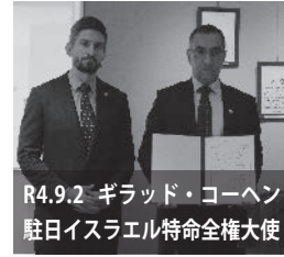
R4.9.2 ギラッド・コーヘン駐日イスラエル特命全権大使