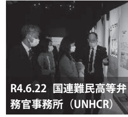
R4.6.22 国連難民高等弁務官事務所 (UNHCR)