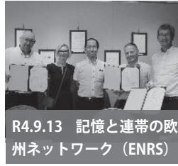
R4.9.13 記憶と連帯の欧州ネットワーク (ENRS)