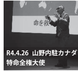
R4.4.26 山野内駐カナダ特命全権大使