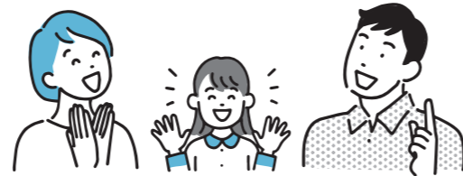
児童クラブ一覧(令和5年4月~)