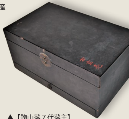
▲【鞠山藩7代藩主】 さかいただまさ 酒井忠毗所用御箱(鞠山神社所蔵)