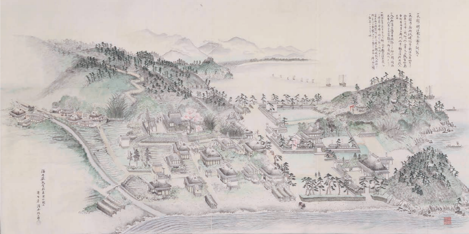
▲鞠山陣屋絵図(鞠山神社所蔵)

ごみ排出量情報(1人1日当たり) 目標値 963g 令和4年度8月まで 1,045g 達成状況 82g 超過 ワンポイントアドバイス 紙コップ、紙皿、割り箸など使い捨ての物はできるだけ使わないようにしましょう!