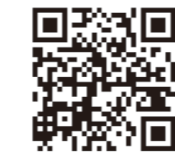
▲インターネット予約