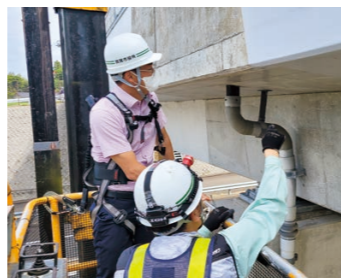
▲橋梁安全点検の様子

今回の研修では、8月の大雨による災害で被害を受けた現場の確認や橋梁の安全点検と、冬の到来を前に、消雪施設などの点検に随行しました。土木分野の仕事は、目に見えるものとは限りません。関係する業者の方々など、見えないところで熱心に働いている方々がたくさんいて、私たちの生活が便利になっていることを再確認しました。これまで、日本の土木技術を学んできましたが、研修を通して日々発展している分野だと改めて感じました。東海市に帰っても今回の研修内容を踏まえて一層勉強し、土木技師として研鑽していきたいです。