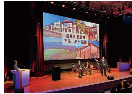
▲北前船寄港地フォーラム in フランス・パリで「北前船寄港地 敦賀」を紹介する渚上市長（10/18）