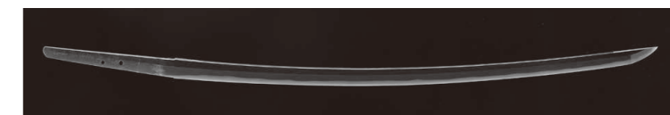
▲太刀 一越州敦賀住盛重作(敦賀市指定文化財)