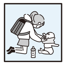
▲幼いきょうだいの世話