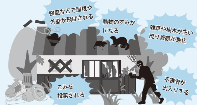
危険な空き家が及ぼす地域への影響（イメージ）

近年、老朽化した空き家などが全国的に増加し、社会問題となっています。市においても、放置されている空き家などが周囲に悪影響を与えている事例が増えていることから、空き家などの適切な管理や利活用を推進しています。