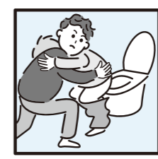
▲障がいや病気のある家族の介助