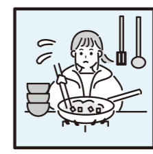
▲家族に代わり家事