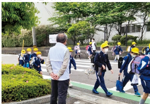
▼児童たちの登下校を見守る様子

令和4年12月1日に民生委員児童委員の改選が行われ、新しい体制でスタートを切りました。 委嘱状況は下記のとおりです。