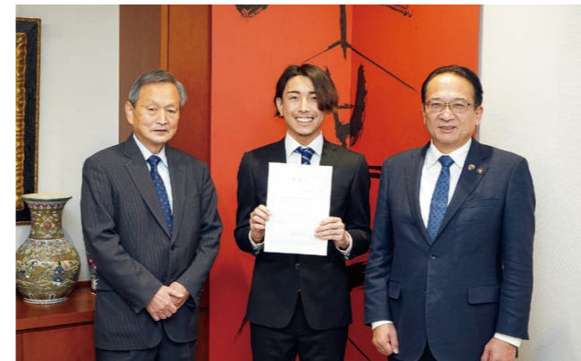
▼委嘱状を受け取った黒川さん（中央）