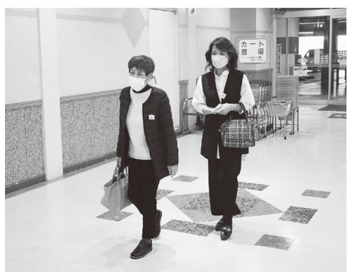
▲市内大型量販店で活動する様子

2人1組で補導員が市内の量販店、ゲームセンターなどを巡視して、青少年の非行防止のために、あたたかい声かけを行っています。 子どもたちを取り巻く環境は年々、複雑になってきています。明るく元気な子どもたちの声が響くように、ちょっとした変化に気付けるように、今日も活動しています。