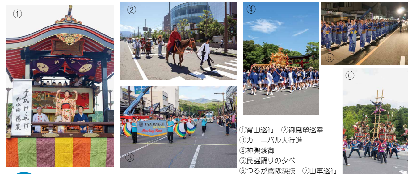
①宵山巡行 ②御鳳輦巡幸 ③カーニバル大行進 ④神輿渡御 ⑤民謡踊りの夕べ ⑥つるが鳶隊演技 ⑦山車巡行