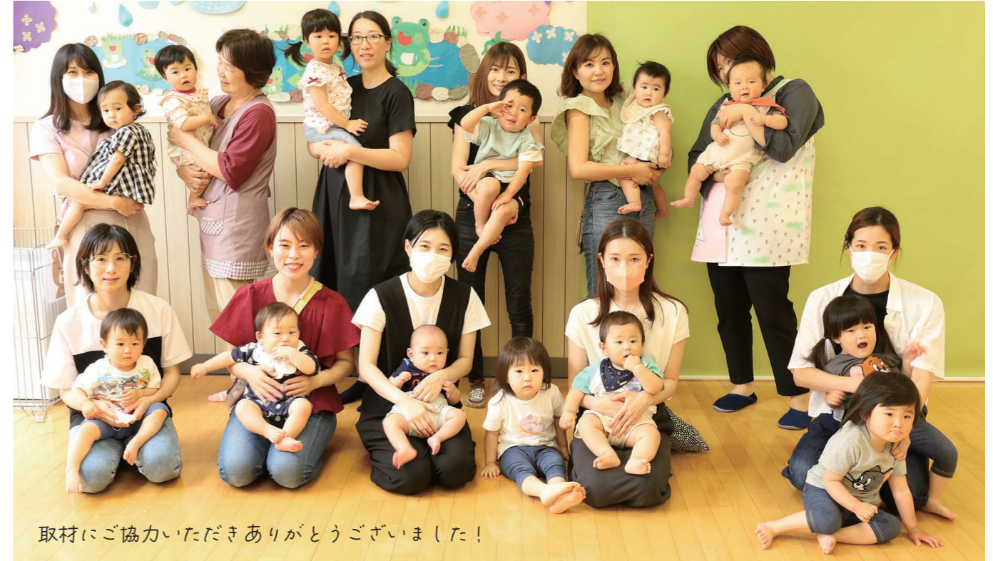
取材にご協力いただきありがとうございます！

敦賀市では子育て家族を応援する場として子育て支援センターを設けています。「子どもをおもいっきり遊ばせたい」、「子育て中の人と交流したい」、「子育ての悩みを相談したい」…毎日の育児で大変なことや困っていることは、ひとりで悩まずにお気軽にご相談ください。