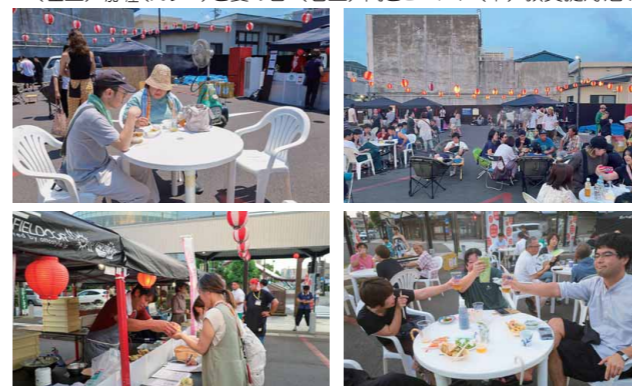
▼(左上)咖喱(カレー)と夏の日 (右上) 肉とビール、(下) 敦賀提灯酒場

北陸新幹線敦賀開業に向けて、様々な人々が参画して開業機運の醸成や賑わいの創出を図る「敦賀をひろげるプロジェクト」。そのプロジェクトから生まれたゼロイチフューチャーズが昨年度に引き続き企画しました。今年度は、角鹿会の協力も得て本勝寺だけでなく、本妙寺、妙顕寺を会場にイベントを実施。このイベントは、身近にあるお寺を会場とすることで地域や子どもをつなげ、昔ながらの寺子屋を現代風にアレンジした新しい形の「居場所づくり」の創出を目的としたものです。本勝寺では、ヴィーガンカレーづくりや写経体験、本妙寺ではアクセサリ作りなど、妙顕寺では茶道体験や駄菓子釣りゲームなどが催され、参加者たちはお寺での夏まつりを楽しんでいました。