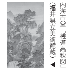
内海吉堂「棧道高秋図」 (福井県立美術館蔵)

特別展 没後100年記念「内海吉堂」展 近代の郷土画家・内海吉堂の没後100年にあたり、敦賀で生まれ、京都画壇で活躍した吉堂の画業について、新出資料もまじえてご紹介いたします。 開催期間 9/14(木) ▶ 11/5(日) 前期：9月14(木)～10月9日(月)祝 後期：10月11日(水)～11月5日(日) 料金：一般300円（高校生以下無料）