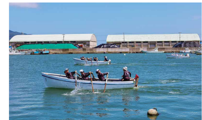
▼声を掛け合い、力いっぱいオールを漕ぐ様子

7月最終の金曜から日曜にかけて、神楽広場で「敦賀提灯酒場」「咖喱(カレー)と夏の日」「肉とビール」が開催されました。各イベントは、地元有志が中心となって企画され、連日の猛暑の中多くの参加者で賑わいました。「敦賀提灯酒場」や「肉とビール」では、提灯のように頬を赤く染めた参加者の笑顔がみられました。「咖喱(カレー)と夏の日」では、テイクアウトされる方もたくさんいましたが、大粒の汗を流しながら「太陽の下で食べるカレーも最高」と話す参加者もいました。