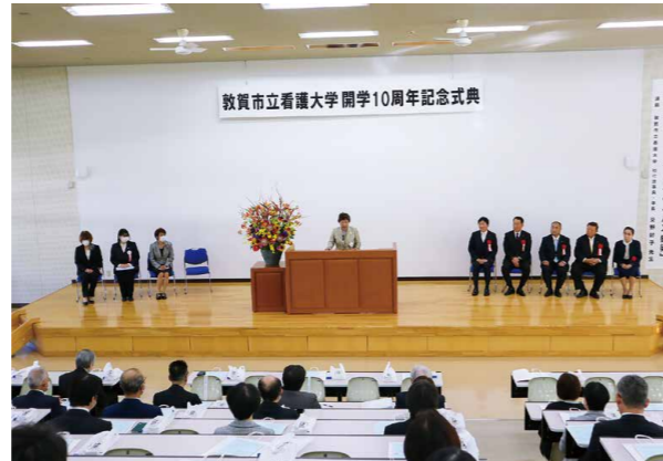
▼挨拶を述べる内布理事長兼学長

皆さんの「プラス1」を紹介しませんか?詳しくは、健康推進課(☎25-5311)までお気軽にお問合せください。