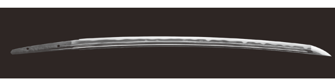
▲刀 於武州江戸越前康継

前期：11/8(水)～12/1(金) 「越前康継と新刀の世界」 後期：12/2(土)～12/28(木) 「敦賀と若狭路の古刀」