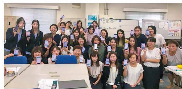
▲明治安田生命保険(相)敦賀営業所

生活に気軽に組み入れる健康習慣を1つ加える「プラス1」運動。毎月、皆さんの「プラス1」を紹介しています。 ウォーキングラリーで健康年齢若返り!