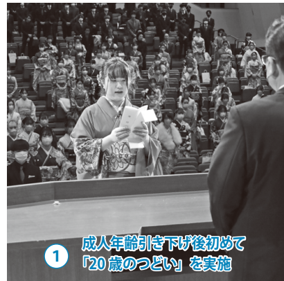
1 成人年齢引き下げ後初めて「20歳のつどい」を実施