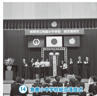
14 角鹿小中学校総合落成式