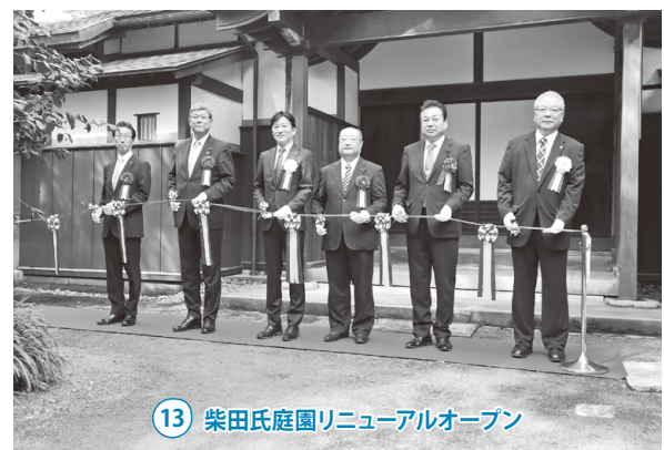
13 柴田氏庭園リニューアルオープン