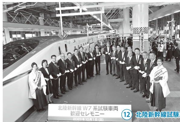
12 北陸新幹線試験車両歓迎セレモニー