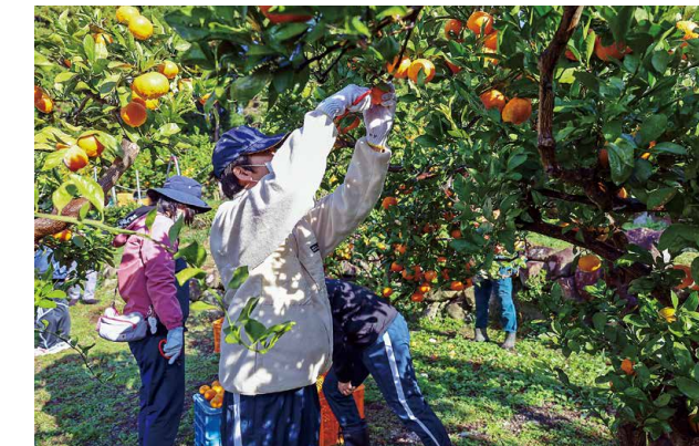
▼丁寧に実を切り落とし収穫している様子

環境保全の重要性について理解を深めるため、市内企業や団体で構成する「つらが環境みらいネットワーク」主催で開催されました。会場のきらめきみなと館では、企業や団体による展示ブースや環境コンクールで入賞した作品の展示が行われました。特別展示では、プラスチックごみが漂着している現状が紹介された「つらがの海」と、金ヶ崎から中池見とつながるルートに注目した「中池見湿地」が紹介されました。その他にも、特別講演会やパネルディスカッション、市内高校生によるスポ GOMI イベントなどが催されました。