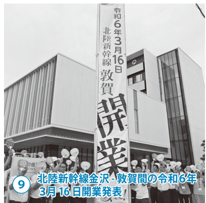
9 北陸新幹線金沢-敦賀間の令和6年3月16日開業発表