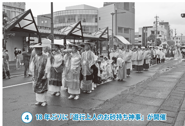
4 18年ぶりに「遊行上人のお砂持ち神事」が開催