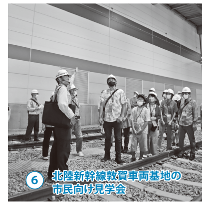
6 北陸新幹線敦賀車両基地の市民向け見学会