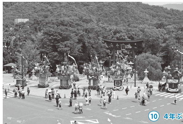
10 4年ぶりの敦賀まつり