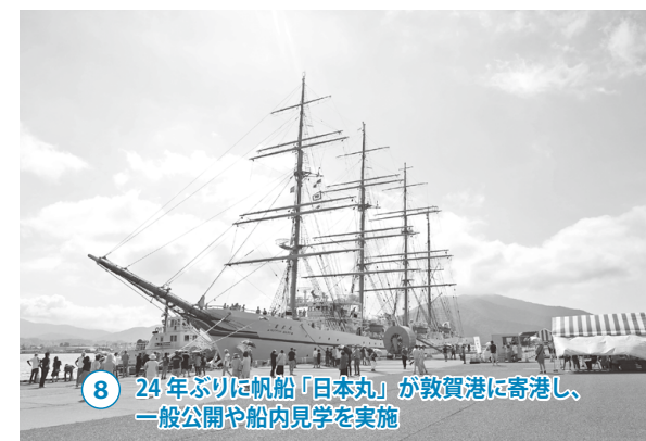
8 24年ぶりに帆船「日本丸」が敦賀港に寄港し、一般公開や船内見学を実施