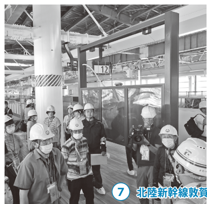
7 北陸新幹線敦賀駅舎の市民向け見学会