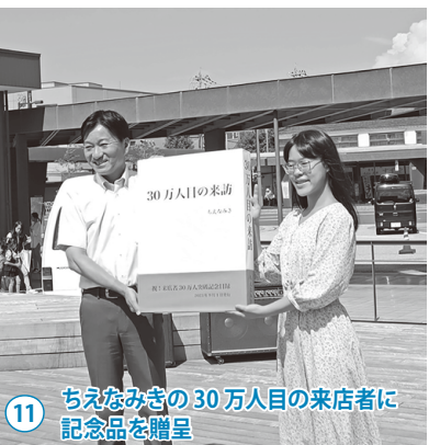
11 ちえなみきの30万人目の来店者に記念品を贈呈