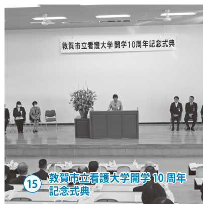
15 敦賀市立看護大学開学10周年記念式典