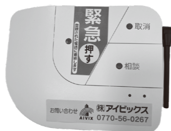
▲無線型の緊急通報装置