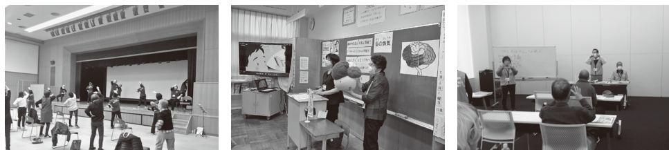
▲元気づくりサポーター (つるが元気体操講習会) ▲認知症サポーター (認知症サポーター養成講座) ▲フレイル予防サポーター (フレイルチェック)

養成講座終了後、サポーターとして活動することで、サポーター限定の勉強会の参加や、活動するごとに敦とんあるこアプリのポイント付与など、特典があります。