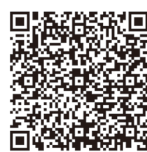
敦賀市情報マップ