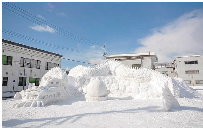
▲過去の最優秀賞作品（作品名「福寿龍」）