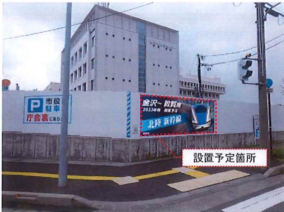
仮囲い掲出イメージ