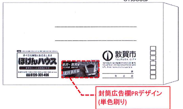
市役所封筒PRデザインイメージ