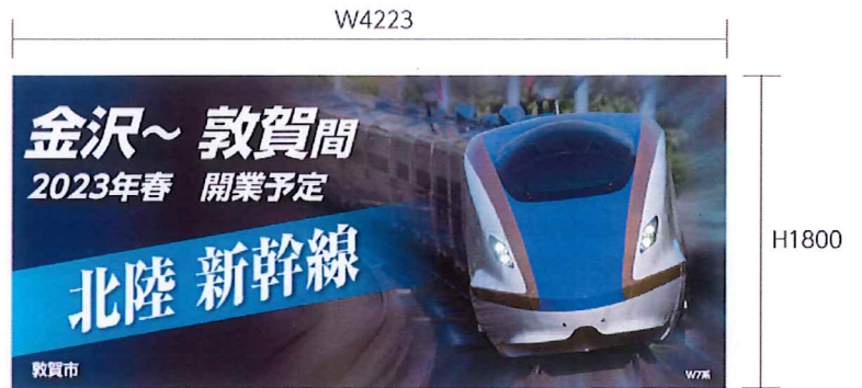
(1) 仮囲い新幹線開業PRシート(W4233×H1800)・(3) 市役所封筒PRデザイン