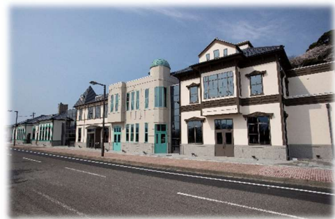
▲ 人道の港敦賀ムゼウム