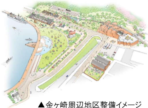
▲ 金ヶ崎周辺地区整備イメージ