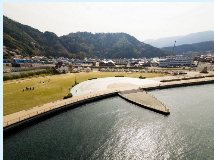
金ヶ崎緑地(金ヶ崎エリア)