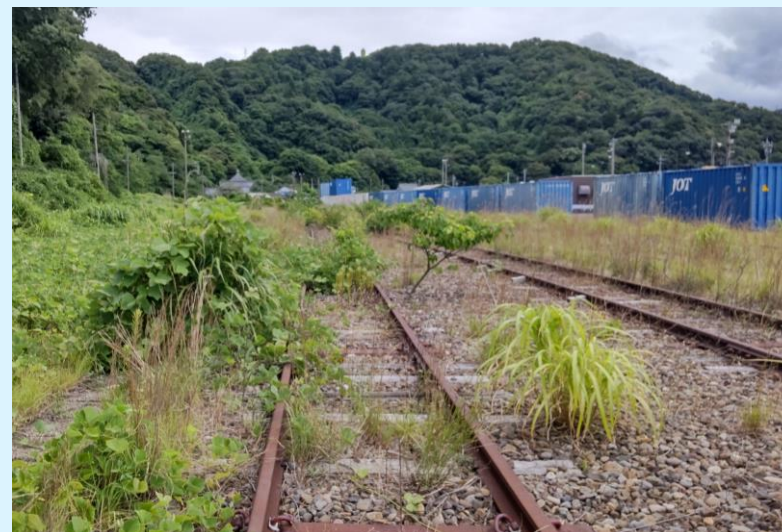
旧敦賀港線廃線敷(金ヶ崎エリア)