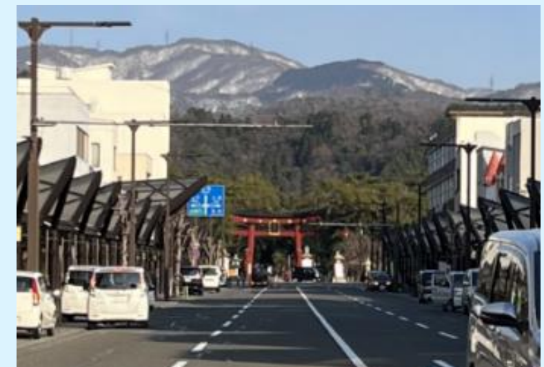
氣比神宮大鳥居・参道(氣比神宮エリア)