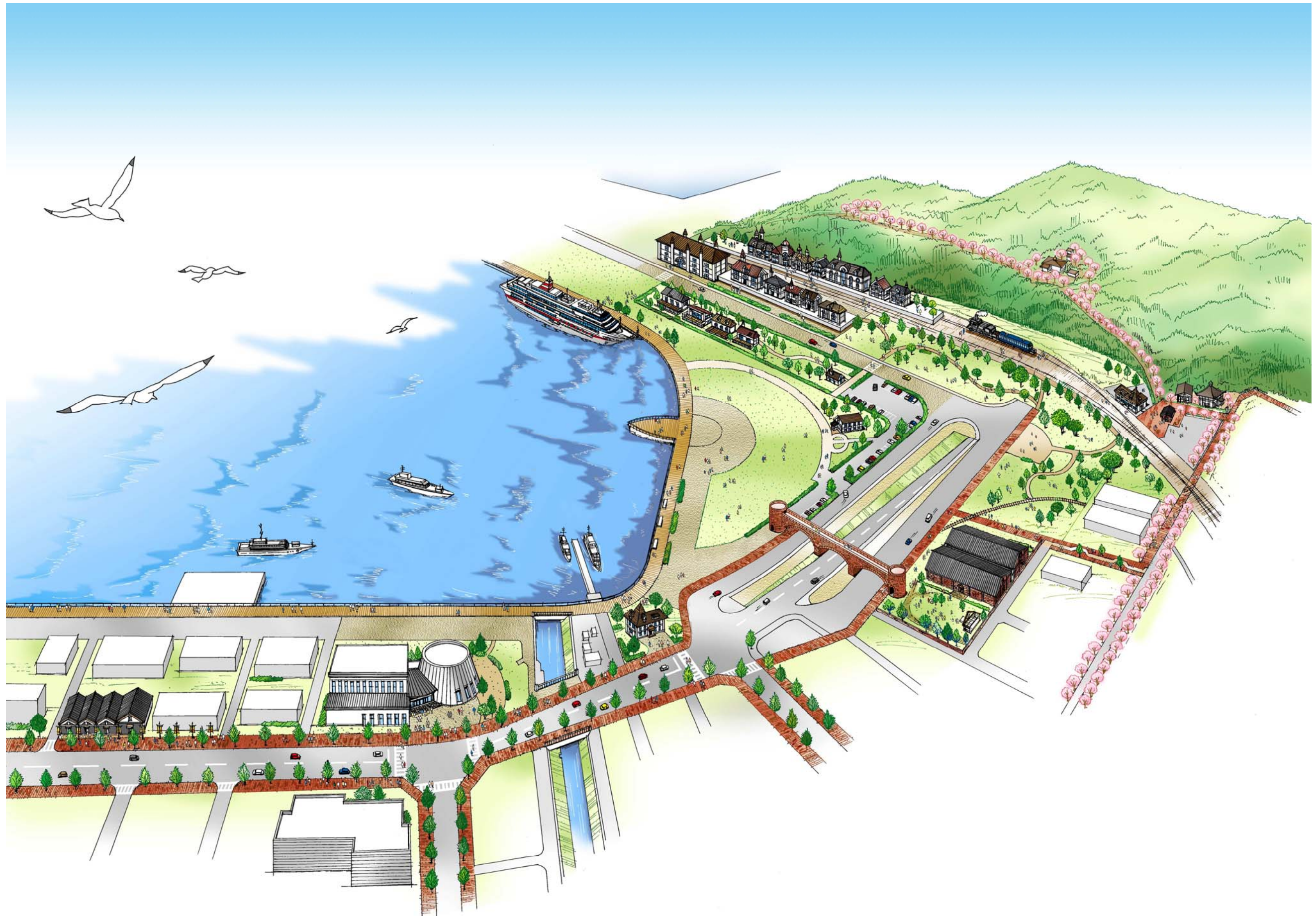
金ヶ崎周辺整備構想 ～敦賀ノスタルジウム～ 将来イメージ図