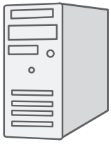
デスクトップパソコン本体