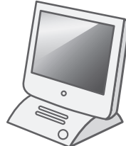
液晶ディスプレイ 一体型パソコン