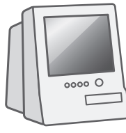
CRTディスプレイ 一体型パソコン