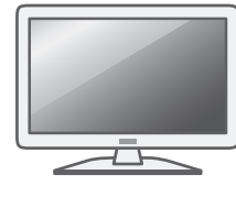
液晶ディスプレイ