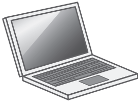
ノートブックパソコン