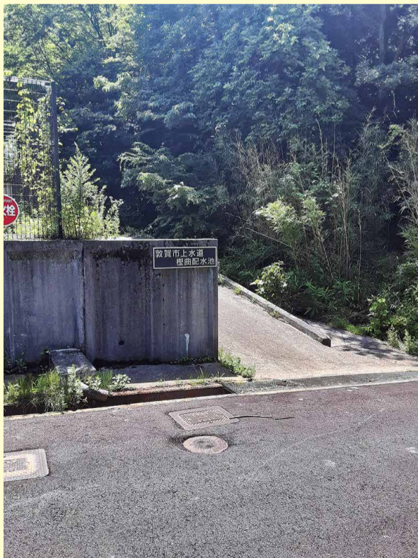
●敦賀市上水道桎曲配水池