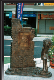
3 少年 星野鉄郎