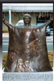
F スカルダートの罠