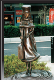
4 メーテルとの出会い