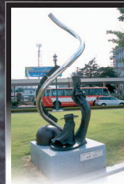
1 星野鉄郎とメーテル