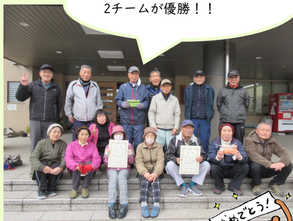
3月8日（日） 敦賀市主催 【市民スティックリング大会】