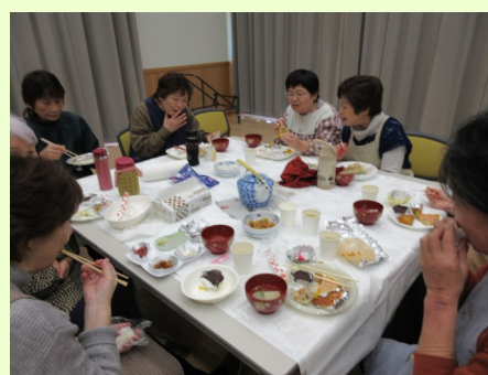
3月1日（日） 東郷女性の会主催 【料理を楽しむ会】