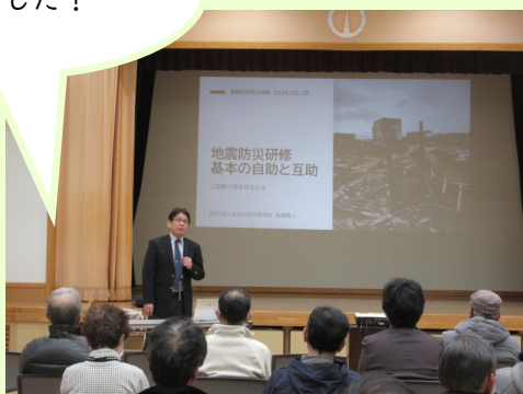
2月28日（土） 東郷コミュニティ運営協議会主催 【防災講演会】