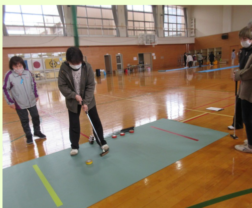
3月8日（日） 敦賀女性の会主催 【スポーツ交流会】