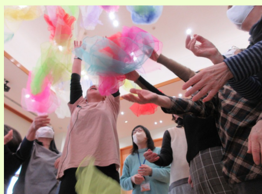
2月25日（水） 東郷地区社会福祉協議会主催 【ミュージックケア教室】