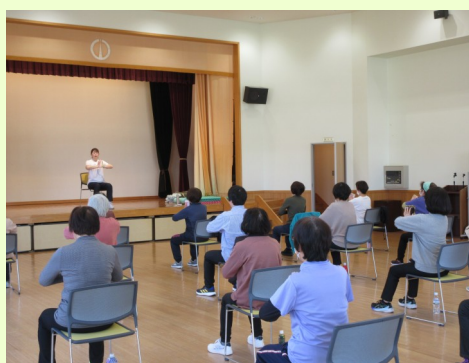
2月21日（土） 公民館主催 【貯筋体操】