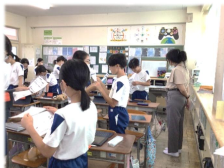
外国語指導助手(ALT)との チーム・ティーチング