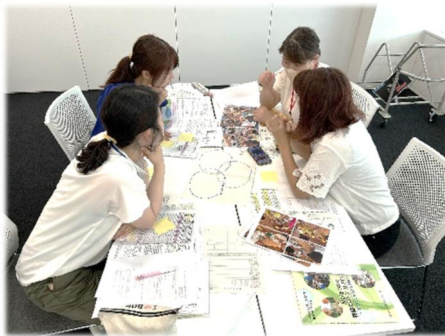
教職員研修 グループワークの様子