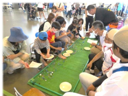
親子のフェスティバル