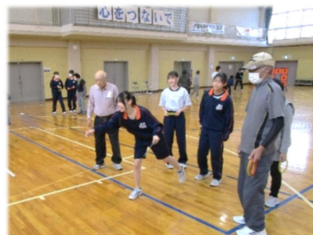
ふれあい教室（地区×学校）