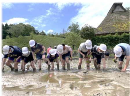
中池見で田植え体験