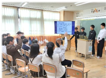
異学年同士の交流