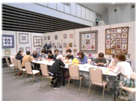
自主学习教室文化祭「ホビフェス」