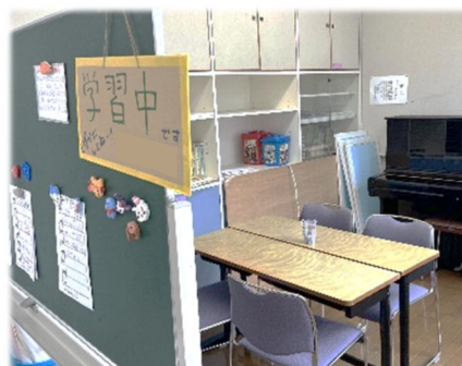
校内サポートルーム