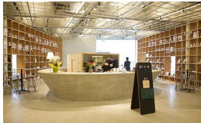
那須塩原市図書館みるるのカフェ（左上）と須賀川市民交流センターカフェスペース（右下）