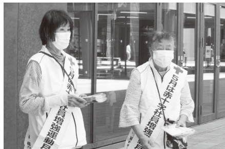
▶赤十字月間街頭キャンペーン