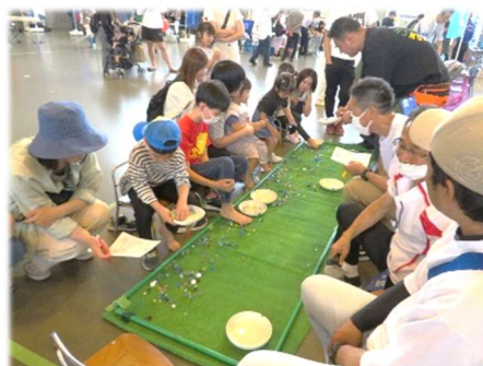
親子のフェスティバル