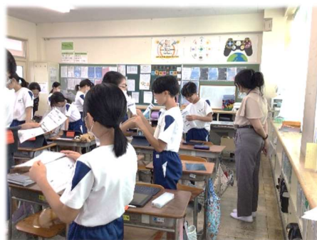
外国語指導助手(ALT)との チーム・ティーチング