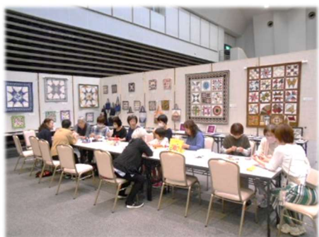
自主学習教室文化祭「ホビフェス」