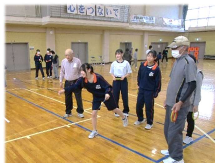
ふれあい教室（地区×学校）