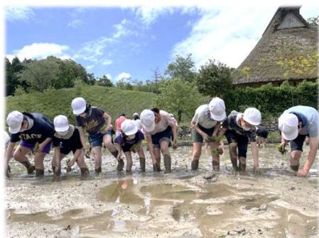
中池見で田植え体験