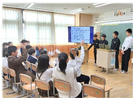
異学年同士の交流