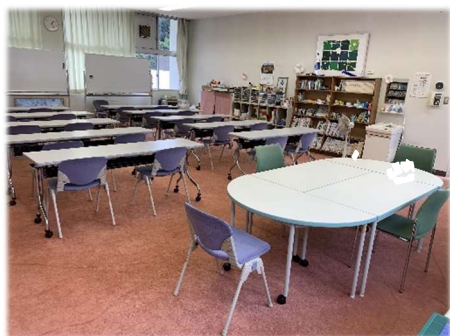
学習室（ハートフル・スクール）