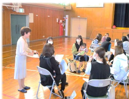
入学前の子育て講座