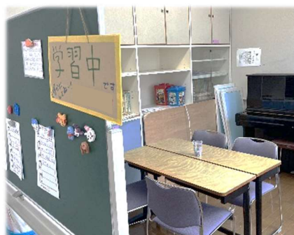
校内サポートルーム