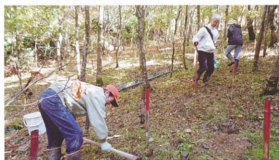
ボランティアによる森づくり活動（永平寺町）