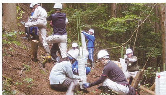
子ども達の森林学習活動（小浜市）