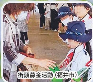
街頭募金活動 (福井市)