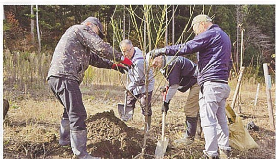
地域での緑化活動（大野市）