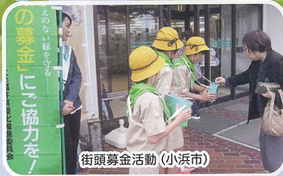
街頭募金活動 (小浜市)