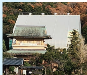
完成した巨大な覆屋は 敦賀駅新幹線ホームからも見えます