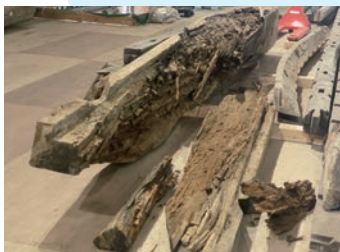
破損している部材