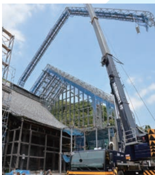
地組みしたトラスを クレーンで吊り上げ