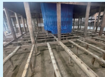
柱と骨組みだけになった