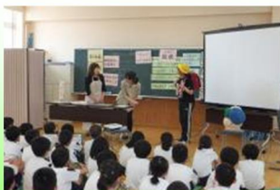
小学校や中学校でも