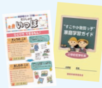
家庭学習ガイドの活用