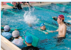
小学校 水泳授業の民間委託