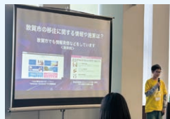
民間によるプログラミング教室 の開催