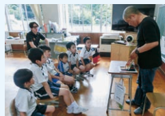
本の読み聞かせ活動