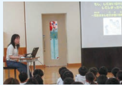
警察職員による 非行防止授業