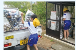
奉仕活動(アルミ缶回収)