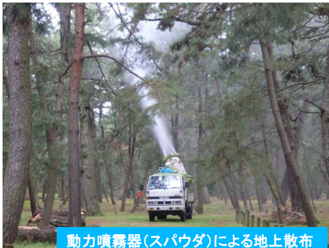
動力噴霧器(スパウダ)による地上散布