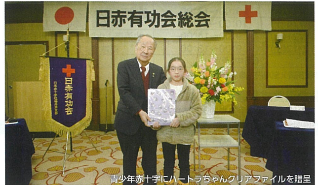
青少年赤十字にハートラちゃんクリアファイルを贈呈

福井県日赤有功会は、赤十字活動に賛同した有功章受章者で組織されている支援団体です。継続的な寄付などにより赤十字を支えています。