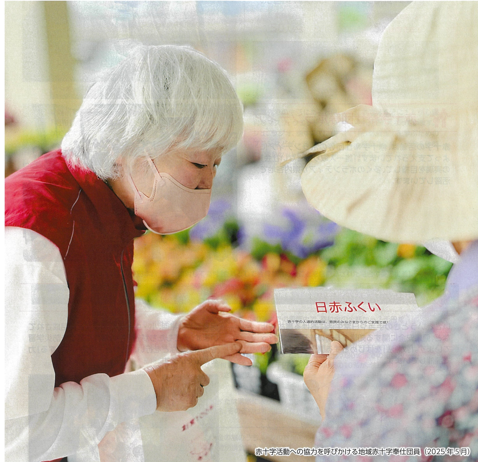
赤十字活動への協力を呼びかける地域赤十字奉仕団員（2025年5月）