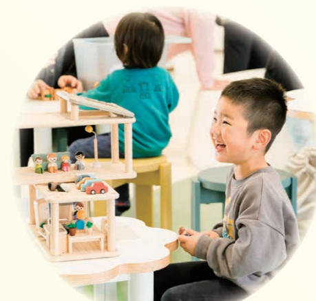
▲れくりぼん たくさんのおもちゃに囲まれたレクリエーションエリア。隣にある玩具ボックスにあるおもちゃを使って今までのテーブル遊びをもっと楽しくできる場所になりました。