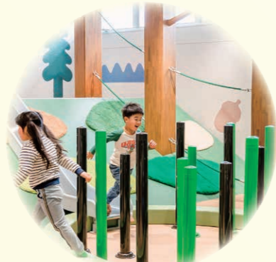
▲ウジャウジャしつげん 池河内湿原の湿原をかき分けるように、ポールをかき分けて進もう。