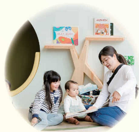
▲りらっころ ゴロンと寝そべったり、本を読んだり、思い思いにくつろげるリラックス空間。やわらかな床と温かみのあるデザインが、利用者に安心感を与え、心も体ものびのび過ごせます。

※あそびお…「遊び」と「ビオトープ（さまざまな生物が自然な形で生息・生育できる空間）」を組み合わせた造語です。