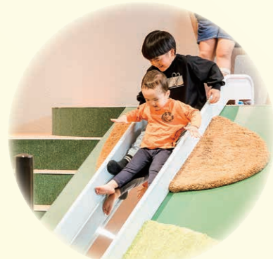
▲すいすいリバー 笹の川を下るように、一気に下って湿地へ飛び込もう。