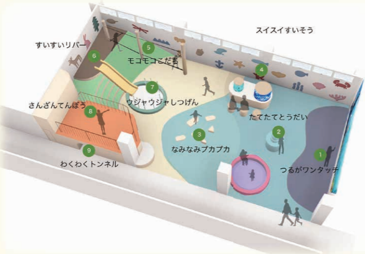
▲スイスイすいそう 敦賀で見られる本物の魚たちを間近で観察しよう。淡水と海水の水槽があります。