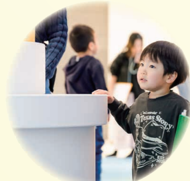
▲たてたてとうだい 敦賀の海のシンボル・立石岬灯台をテーマにした巨大パズル。好きな形に組み立てて遊ぼう。