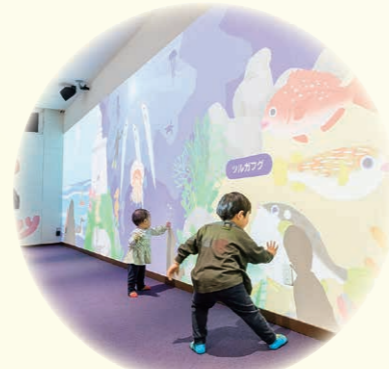
▲つるがワンタッチ かわ、はまべ、うみの3つのシーンを通して、敦賀で見られる生き物に触れよう。