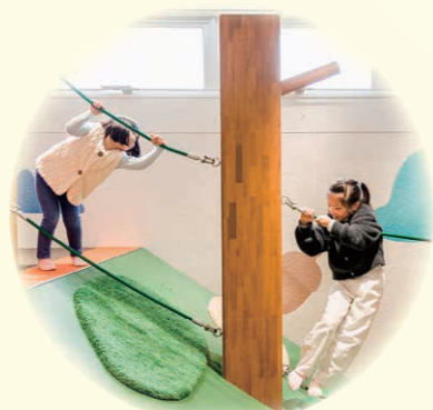
▲モコモコこだち 敦賀の山々を登るように、木々に繋がれたロープを渡って頂上を目指そう。