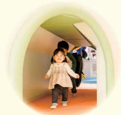
▲わくわくトンネル 旧北陸線走る列車のようにトンネルをくぐろう。車いすのこどもたちも遊べます。

こどもたちが裸足や靴下で安全に、自由に遊べるような環境を整えました。指定の場所で靴を脱いでいただき、開放的な遊びを体験してください。