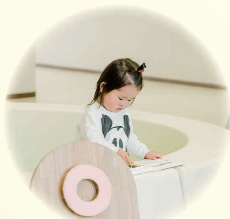
▲よちよち 0・1・2歳のお友達が安心して遊べるエリア。付き添いの保護者の方もそばで見守れます。